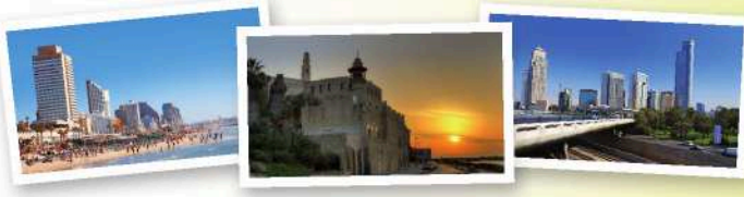
特拉维夫-雅法：融合新旧