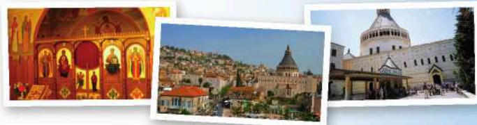
拿撒勒：天使报喜堂