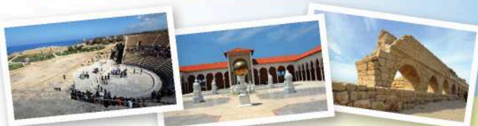
凯撒利亚：希律王的罗马城市