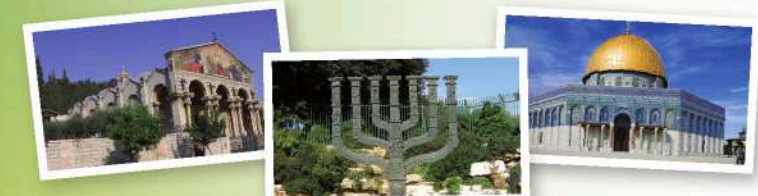
耶路撒冷：三大天启宗教的聖地