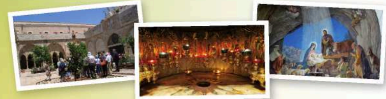
伯利恒：耶稣的出生地