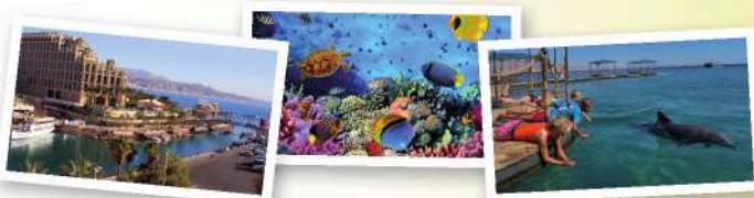
埃拉特：恰似红海的一颗明珠