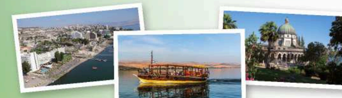
提比利亚-加利利湖