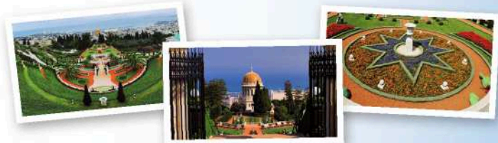
海法，巴哈伊花园：巴哈伊教的全球中心