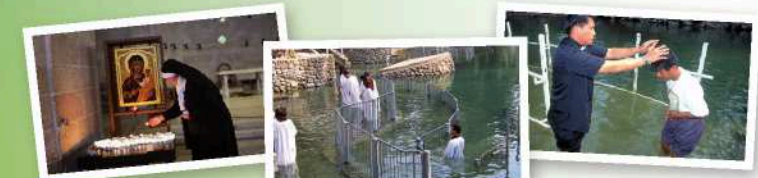
约旦河洗礼场：耶稣先受洗的圣地